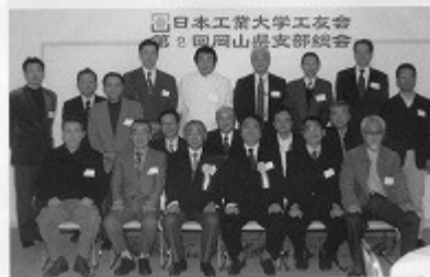
総会に先立ち、工友会副会長一副会長より、ご挨拶をいたす。