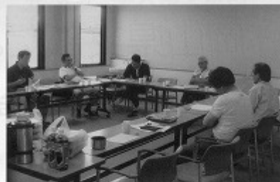
6月12日(日)第2回支部総会、津山市において